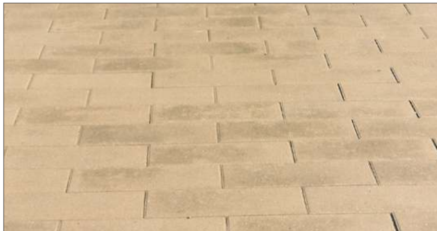
Lader man fugegrus henligge på belægningen, risikerer man afsmitninger, der i værste fald bliver bundet af kalkudfældninger.

Det er vigtigt, at sørge for en god renholdelse af belægningen under udførelsen. Det skal undgås, at belægningen bliver tilsmudset af sand og jord, der slæbes ind på belægningen af maskiner eller fodtøj. Der skal heller ikke opbevares sand og jord på belægning-