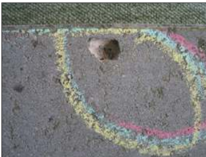
Et hul i overfladen som følge af porøst korn i tilslaget, opstår normalt inden for det første år.

Der kan nogle gange observeres små huller eller fordybninger i overfladen. De vil typisk opstå inden for det første år. Fordybningerne opstår, hvis der i tilslaget af sten og grus også har været noget porøst materiale, f.eks. en lille hård lerklump. Denne kan ikke ses efter støbningen, men ligger den i overfladen vil den efter nogen tid gå i opløsning og efterlade en fordybning. Derfor er det ikke muligt for producenten at sortere emnet fra før levering. Det må ikke være generelt forekommende.