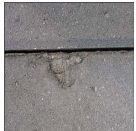
Øverst ses revner i overfladen som følge af fejl i støbningen eller håndteringen. Nedenunder et eksempel på mangelfuld fyldning af formen, der har givet en fordybning i kanten af flisen, skal sorteres fra før lægningen.