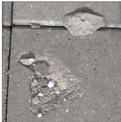
En "kalkspringer", dvs. en vandmættet kalksten har udvidet sig i frostvejr, og presset en flage af betonen.

nerelt. Som tommelfingerregel bør der maksimalt være 10 huller større end 1,5 cm 2 pr. 10 m 2 belægning.