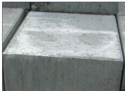
Disse kalkudfældninger er almindelige og forsvinder i løbet af 1-2 år.

Kalkudfældninger kan opstå på nye betonbelægninger, og er en naturlig del af hærdeprocessen. Udfældningerne forsvinder normalt i løbet af 1-2 år, i særlige tilfælde op til 3 år. Kan man ikke vente på at de forsvinder, eller er