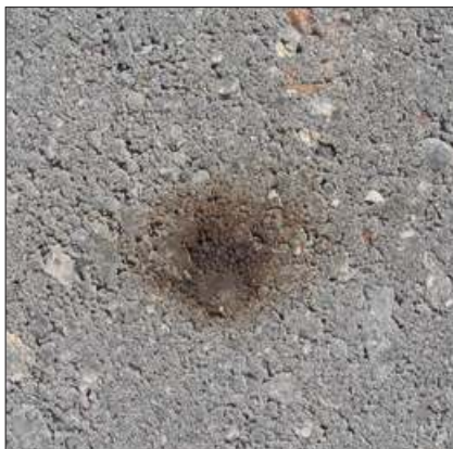
Forskellige former for jernudfældninger. Nogle typer forsvinder med tiden, andre gør ikke.