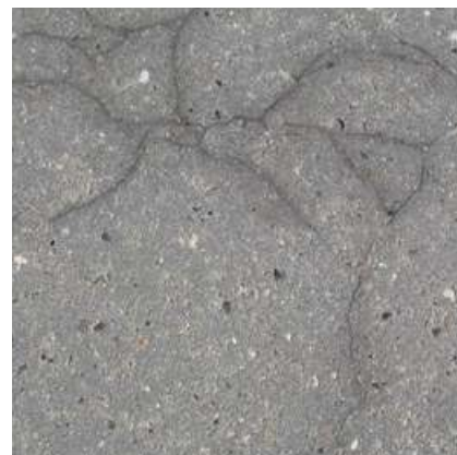
Eksempel på alkalikiselreaktioner, også kaldet "spindelvæv".

I alt beton, er der risiko for alkalikiselreaktioner, men i betonsten og -fliser er risikoen meget lille pga. flere forhold. Reaktionen består i, at porøs flint reagerer med cementen og danner en gel. Denne gel kan suge vand og eks-