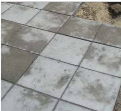
Varierende porestruktur kan give et udseende som dette, når fliserne tørrer ud efter regnvejr. Det er ikke tegn på manglende modstandsevne over for påvirkninger fra frost/tø og salt.

har været våde, vil man kunne se, at der er forskel på, hvor hurtigt de tørrer igen. Nogle tørrer på få timer, andre bruger et døgn eller mere. Der er tale om uundgåelige variationer, som kun har betydning for flisens udseende. En flise med en åben struktur, har ikke større risiko for skader som følge af frost/tø-påvirkninger og salt end en med mere lukket struktur. Betonens struktur vil med tiden blive mere lukket, da partikler fra omgivelserne og kalkudfældninger er med til at gøre dem tættere.